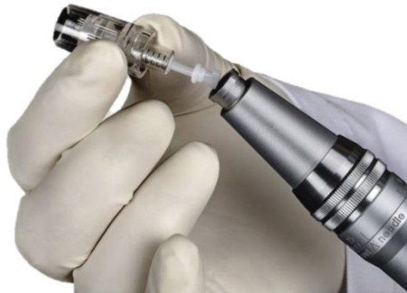
Verjüngung der Haut durch Mikroneedling